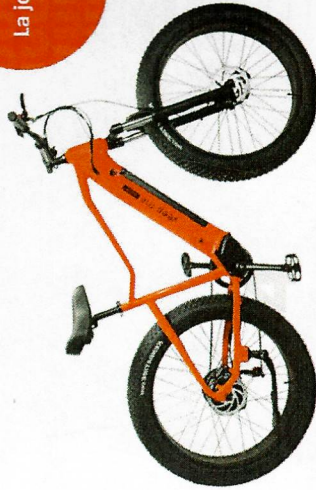
Vélo Cargo électrique