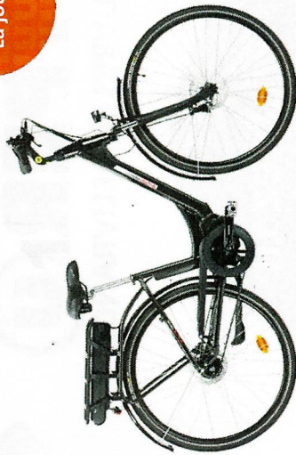
VTT Electrique Premium