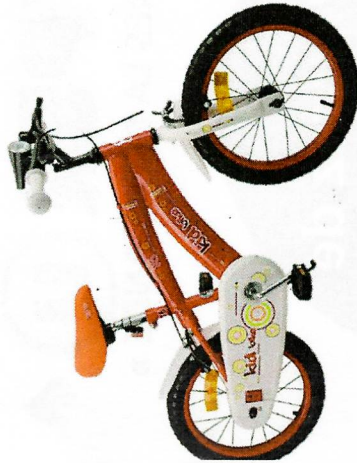
Vélo enfant 20 pouces