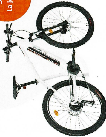
Vélo pliant électrique