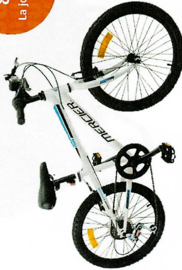
Vélo enfant 24 pouces