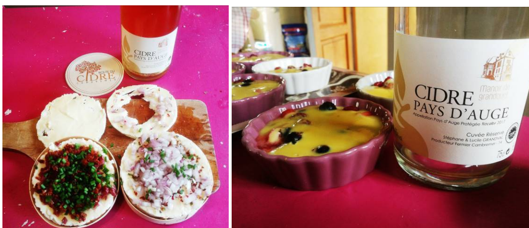
cidre et camembert chaud ou sabayon au cidre et fruits rouge ? les deux, merci

Les fromages, la crème fraîche, les crustacés et autres produits de la mer, le jus de pomme, le cidre, le pommeau et le calvados de Normandie vous attendent pour de grands instants de gastronomie gourmande.