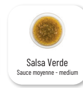
Salsa Verde Sauce moyenne - medium