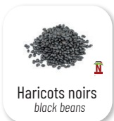
Haricots noirs black beans