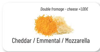
Cheddar / Emmental / Mozzarella

Faites-vous plaisir, le nombre n'est pas limité ! Treat yourself, the number is not limited!