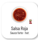
Salsa Roja Sauce forte - hot