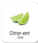
Citron vert lime