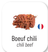
Boeuf chili chili beef