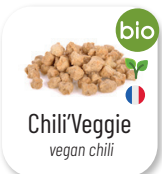
Chili'Veggie vegan chili