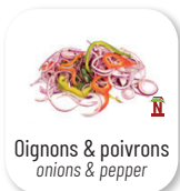
Oignons & poivrons onions & pepper

Faites-vous plaisir, le nombre n'est pas limité ! vegetables, treat yourself, the number is not limited!