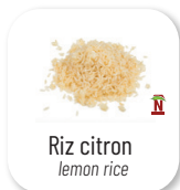
Riz citron lemon rice