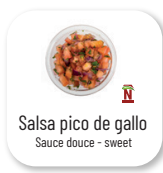
Salsa pico de gallo Sauce douce - sweet

Sauce douce ou très piquante ? C'est à vous de choisir ! SAUCE, sweet or hot sauce? It's up to you !