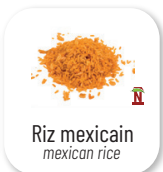
Riz mexicain mexican rice