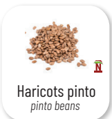
Haricots pinto pinto beans