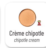
Crème chipotle chipotle cream