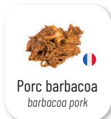
Porc barbacoa barbacoa pork