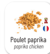
Poulet paprika paprika chicken