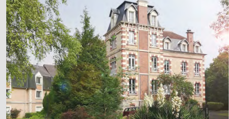
Imprimé par www.pixartprinting.fr Via 1° Maggio, 8 30020 Quatro d'Attino VE ITALIA