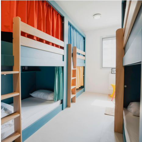
Chambres de 6 ou 8 personnes