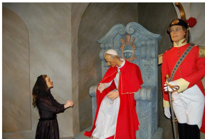
(@Sanctuaire de Lisieux)