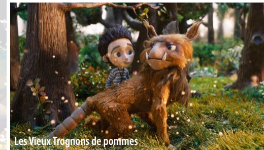
Les Vieux Trognons de pommes

Pour inventer une belle histoire, il faut... Un, deux... trois ingrédients ! Pas un de plus, pas un de moins. Eh oui, c'est la recette de sa grand-mère qu'a choisi de suivre Suzanne pour aider ses petits frères (et elle-même) à surmonter la perte de cette dernière. D'ailleurs, ici, tout fonctionne par trois : les ingrédients, les enfants et les histoires. Le tout dans le chapeau de Mamie ! Avec ces jeunes héros, plongez dans trois récits magiques, à la frontière du fantastique. Ce sont trois petites bulles d'imaginaire dans le week-end un peu triste, tout du moins au début, de Suzanne et ses petits frères. Et, à mesure que les contes envahissent le réel, les sourires reviennent et la famille se retrouve progressivement.