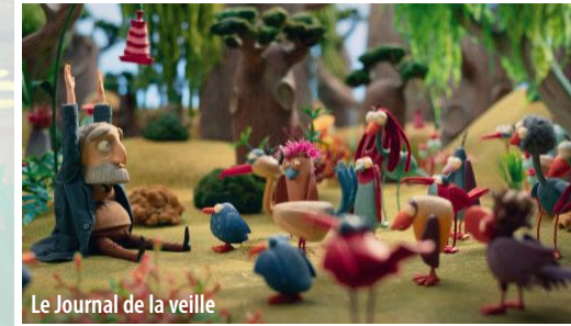
Le Journal de la veille