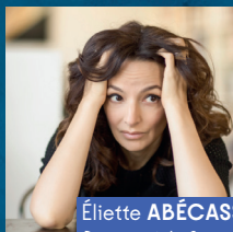
Éliette ABÉCASSIS Divorce à la française