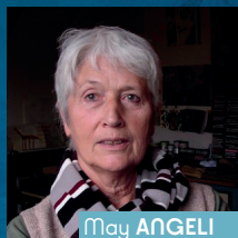
May ANGELI Le livre de la jungle Seuil jeunesse