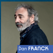
Dan FRANCK Le roman des artistes