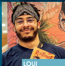
LOUI RedFlower Glénat