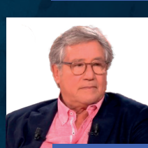
Patrick SABATIER Ne le dis surtout pas à Paul