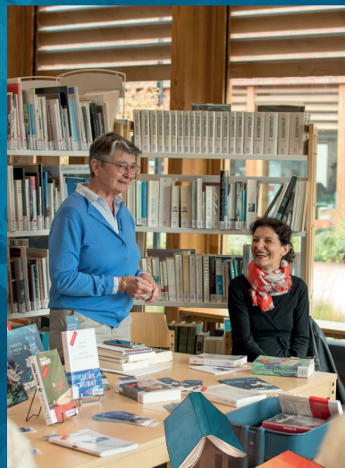
Table ronde des amis de Cabourg