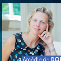
Amélie de BOURBON PARME Les Trafiquants d'Éternité - L'Ascension