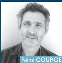
Rémi COURGEON Le vieil homme et les mouettes Seuil jeunesse