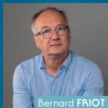
Bernard FRIOT Histoires pressées Milan