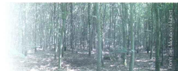
Forêt des Moutiers-Hubert