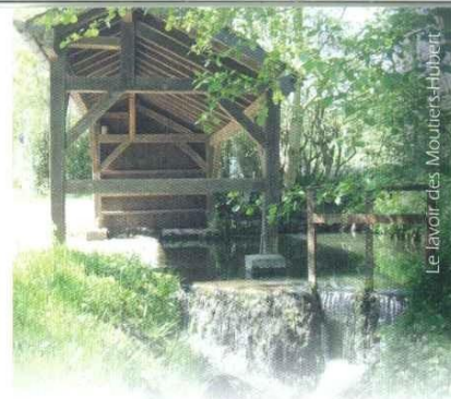
Le lavoir des Moutiers-Hubert

En 1868, le dernier loup fut tué sur les terres des Moutiers-Hubert. Il est empaillé et conservé dans la salle de la mairie. Au XIX e s, le loup fait l'objet d'une chasse intense en vue de son éradication. Le Conseil Général du Calvados accorde des primes importantes pour sa capture allant de 10 francs pour un louveteau à 50 francs pour une louve pleine. Après avoir coupé l'oreille et la patte de l'animal en présence du maire, celui-ci rédige un procès-verbal pour l'attribution de la prime.