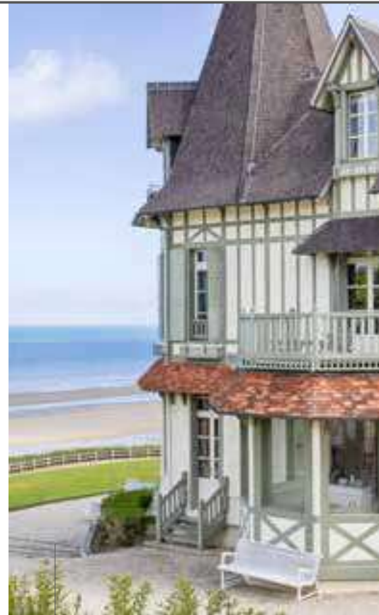
Domaine de l'Abbaye Deauville, Bénéville-sur-Mer