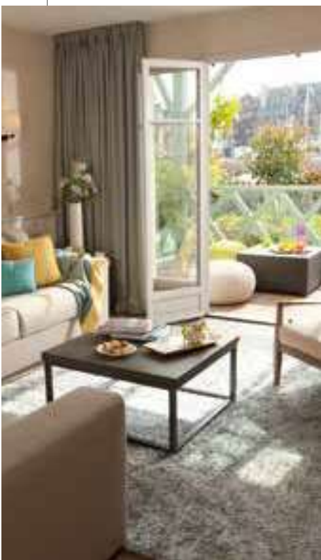
Pierre & Vacances Premium - Résidence la Presqu'île de la Touques *****, Deauville