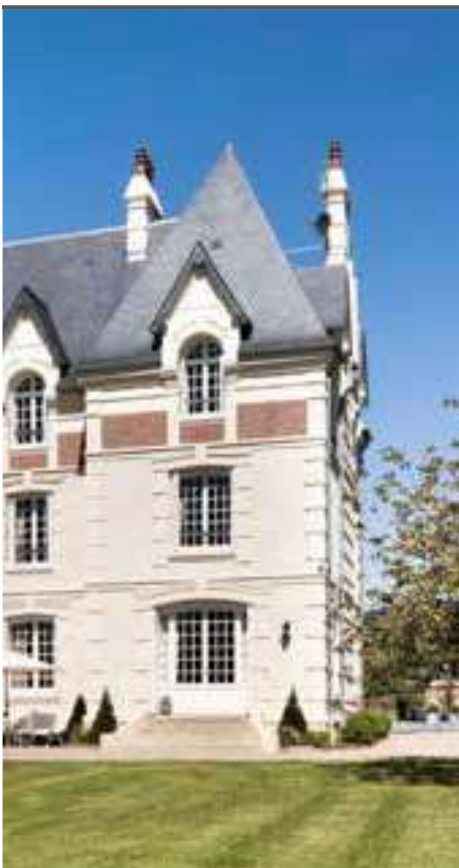
Villa L, Tourgéville