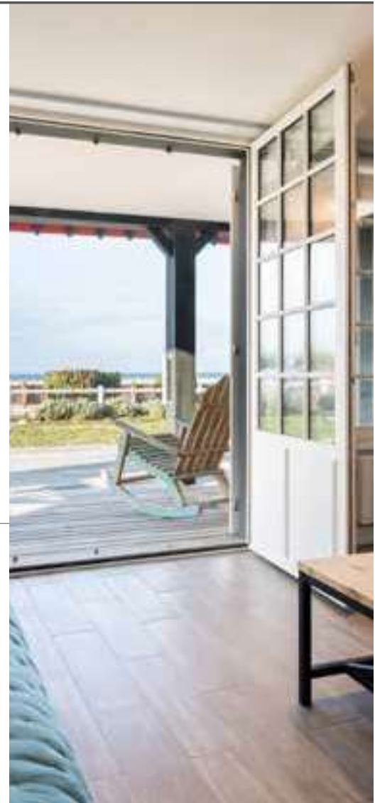
Chalet de la Plage, Deauville

Un lieu où il est possible de séjourner entouré d'œuvres d'art à acquérir • A place where it is possible to stay surrounded by works of art to buy 38-40 rue Victor Hugo 14800 DEAUVILLE +33 (0)2 31 14 97 77 Maison • house (4 chambres • rooms/8 pers.) > 4500 €/semaine • week > 1500 €/week-end