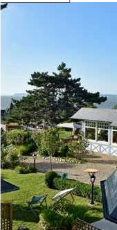
Hôtel Le Bellevue ***, Villerville