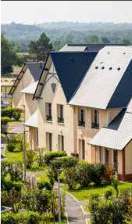
Résidence Goélia Le Victoria ****, Blonville-sur-Mer