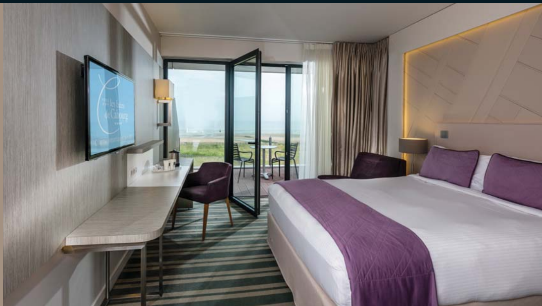
Chambre Exclusive front de mer