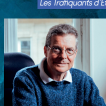
Antoine Compagnon La littérature ça paye !