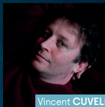
Vincent CUVELLIER Série : Emile Gallimard jeunesse