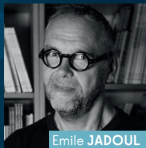
Emile JADOUL Série : Léon Ecole des loisirs