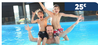
Pass semaine* - baignade illimitée