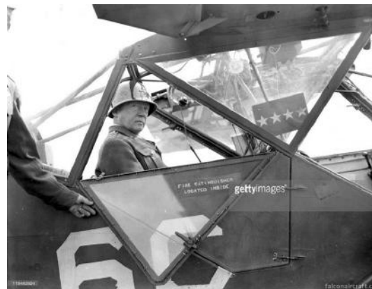
Le Général Patton à bord de son Stinson L-5