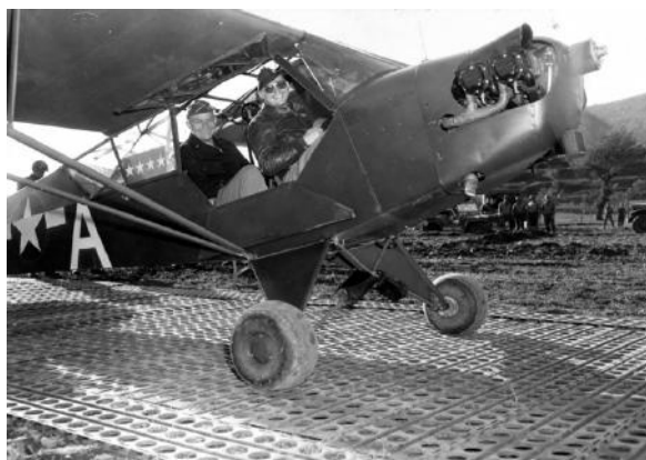
Le Général Eisenhower à bord d'un Piper L-4