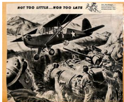
Largage de colis par un Aeronca L-3