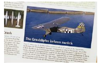
Der Klassiker der Luftfahrt