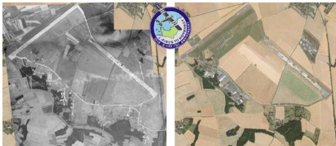
1944 et 2024....

Les anciennes pistes et taxiways, vestiges de la Deuxième Guerre mondiale, offrent une grande capacité d'accueil adapté à notre événement.