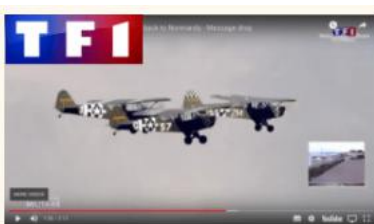
TF1 – Direct live 6 juin 2019 – L-Birds back to Normandy – Largage de message

Notre expertise en matière de L-Birds et histoire du débarquement en Normandie nous ont permis de participer à de nombreuses collaborations médiatiques, que nous renouvellerons dans le cadre du 79e et 80e anniversaire du Débarquement, et au-delà.