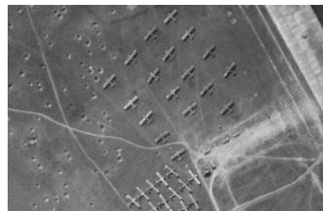
L-Birds stationnés sur l'aérodrome de Saint André de l'Eure en 1944