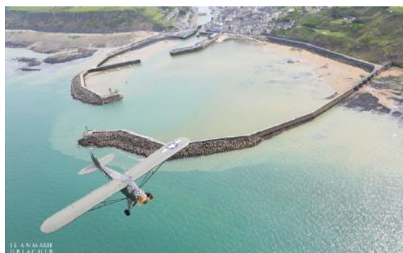
Piper L-4H survolant Port-en-Bessin

Une quarantaine d'avions de liaison, tous authentiques et dans leurs couleurs historiques de 1939-45, rejoindront la Normandie depuis plusieurs régions françaises et pays européens.