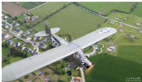
Survol de la Batterie de Merville