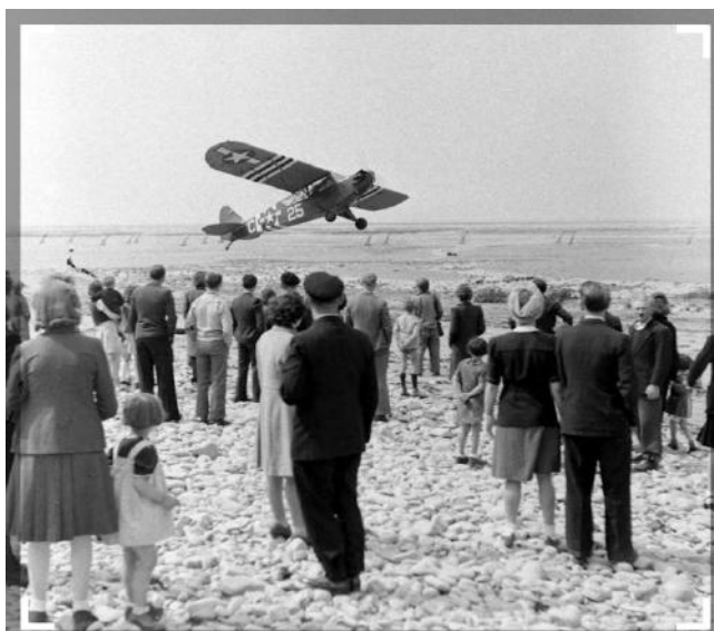
Un Piper L-4 décolle de la plage de Grand Camp

Rapidement assemblés, les premiers décollèrent de pistes sommaires, comme ci-dessous, de la plage de Grand Camp.