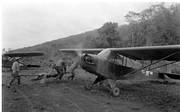
Evacuation de blessés par Piper L-4 et Stinson L-5