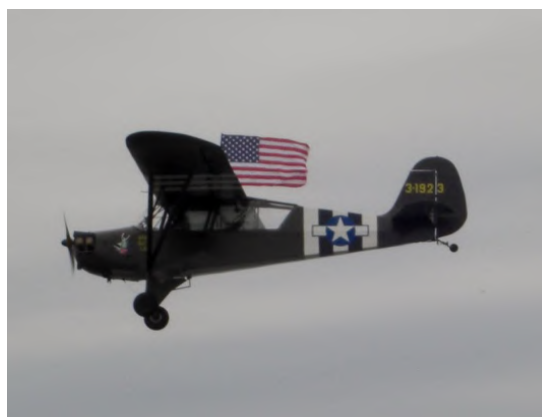
Aeronca L-3 participant à notre événement

L'efficacité des Piper L-4, et autres L-Birds était telle qu'elle augmentait considérablement le potentiel des forces au sol, ainsi que le moral des troupes.