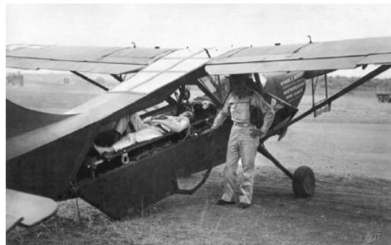
L-5 version ambulance

En se posant discrètement sur des chemins ou pâturages, les blessés sont récupérés et rapatriés assis en place passager, ou allongés sur une civière. Certains modèles de L-Birds sont spécifiquement modifiés pour l'emport d'une civière .