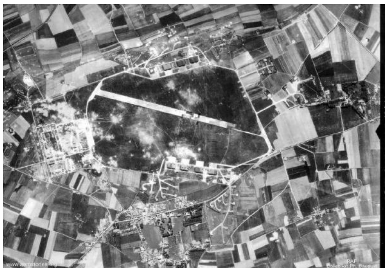
L'aéroport de Caen en 1944

libération de Caen ; de très rudes combats eurent lieu entre la 12e Panzer SS, les Canadiens du Régiment de la Chaudière et les Queens Own Rifles. L'aérodrome est libéré le 8 juillet.