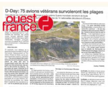
Ouest France, mai 2019

Nous disposerons d'un avion photo, qui nous permettra de fournir des images aux journalistes que souhaiteront couvrir l'événement.