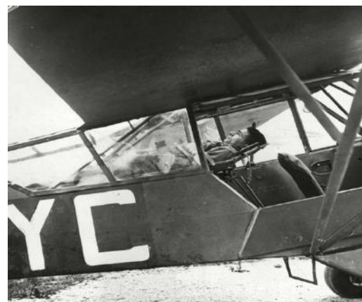
Evacuation d'un blessé à bord d'un Piper L-4