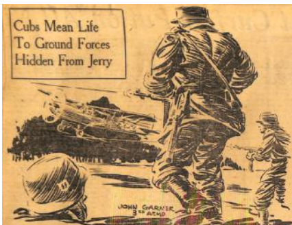
Stars & stripes, février 1945