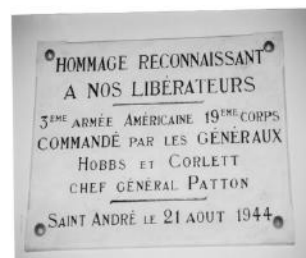
Plaque apposée sur un des hangars de l'aérodrome