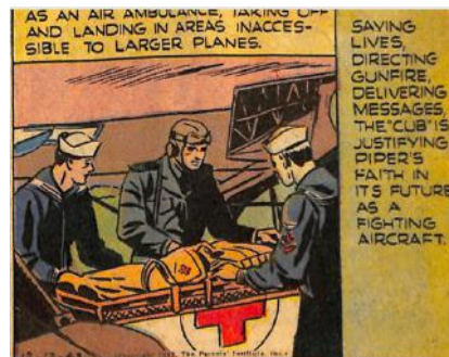
Sunday Star, 8 juillet 1945