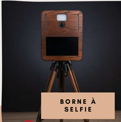
BORNE À SELFIE