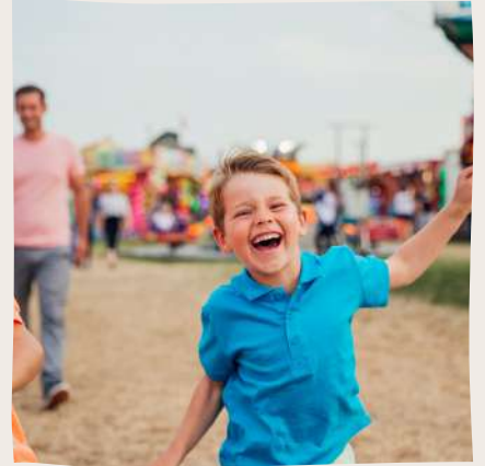
JOURNEE DES FAMILLES