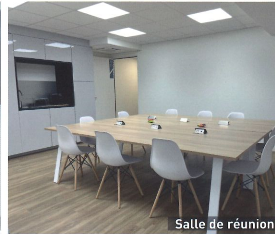
Salle de réunion