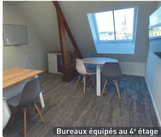
Bureaux équipés au 4 e étage