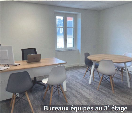
Bureaux équipés au 3 e étage