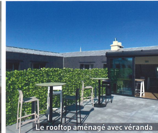
Le rooftop aménagé avec véranda