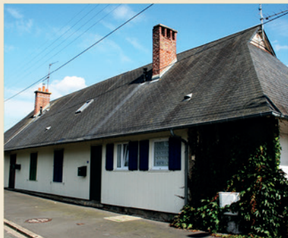
Maison suédoise.