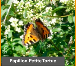
Papillon Petite Tortue