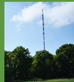
OT du Pays de Vire - B. Nègre OT du Pays de Vire - B. Nègre