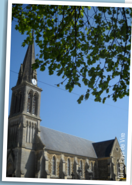
OT du Pays de Vire

(Ouverture sur demande à la mairie) Cet édifice néo-gothique présente un clocher très élancé avec une flèche pointue et ouvragée. L'architecture est à rapprocher de celle des communes voisines de Landes-sur-Ajon et Epinay-sur-Odon ; toutes ont été réalisées par le même entrepreneur.