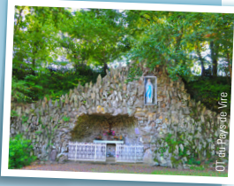
OT du Pays de Vire