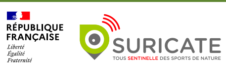
2024 - Mise en page : Suisse Normande Tourisme - Ne pas jeter sur la voie publique