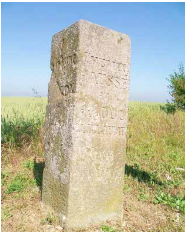
© D. H. P. / Réseau 08