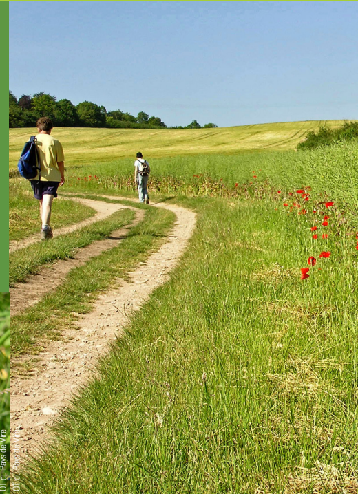
OT du Pays de Vire