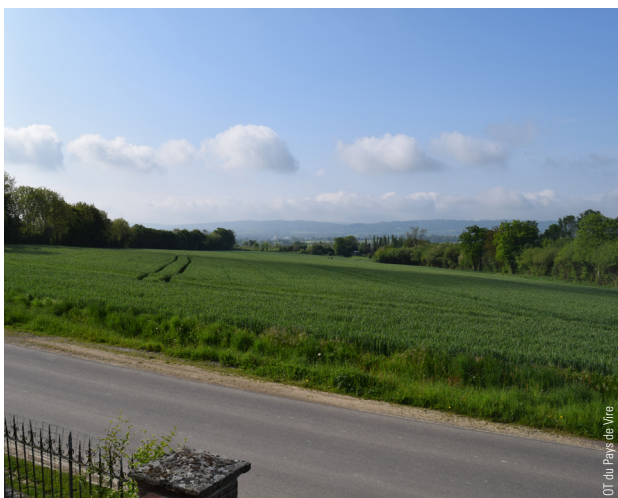
OT du Pays de Vire