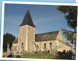
OT du Pays de Vire

(Ouverture sur demande à la mairie) Saurez-vous retrouver, dans cette église, la Vierge de Pitié et la statue de Saint Roch ? Le socle de la Vierge de Pitié représente deux anges et un personnage à genoux qui proclameraient l'Annonciation. Quant à la statue de Saint Roch, elle représente le saint coiffé d'un chapeau à larges bords en bois. Le patron des maladies atteint de la peste désigne son attribut, un bubon, alors qu'un ange le soigne.