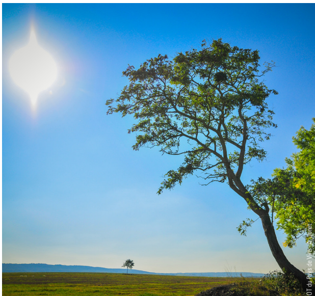
OT du Pays de Vire - A. Jonez