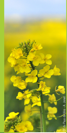
OT du Pays de Vire - A. Jonez