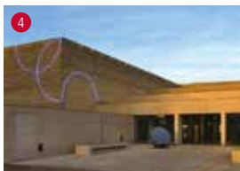
Musée des Beaux-Arts