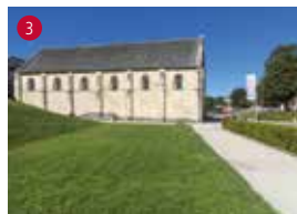
Salle de l'Echiquier des ducs de Normandie