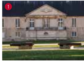
Logis des Gouverneurs : collections permanentes et conservation du musée de Normandie.