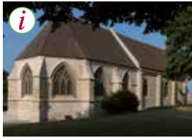
Eglise Saint-Georges, accueil du château et billetterie des musées.

Objet d'un vaste chantier d'aménagement, le château offre de nouvelles vues sur la ville depuis le belvédère aménagé sur le rempart restauré et révèle ses secrets enfouis sous la terrasse d'artillerie reconstituée des salles du Rempart.