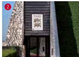
Salles du Rempart : expositions et services du musée de Normandie.