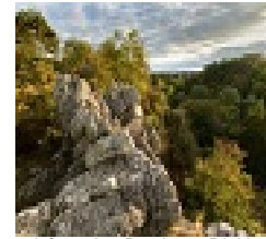
Légende : Breche au Diable

Les deux promontoires rocheux surplombant le Laizon offrent aux promeneurs un superbe panorama. Cette terre de légendes est également un site archéologique de première importance ou furent découverts un abri sous roche et des polissoirs qui attestent d'une très ancienne occupation humaine du site.